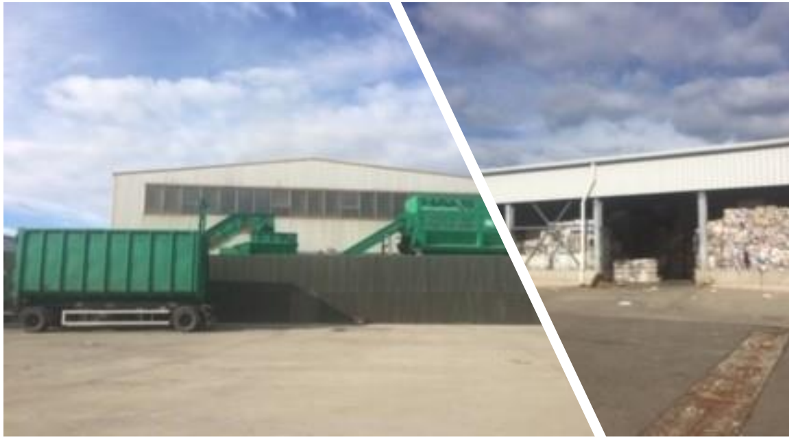
Figura 2-1 Stația de sortare Aninoasa