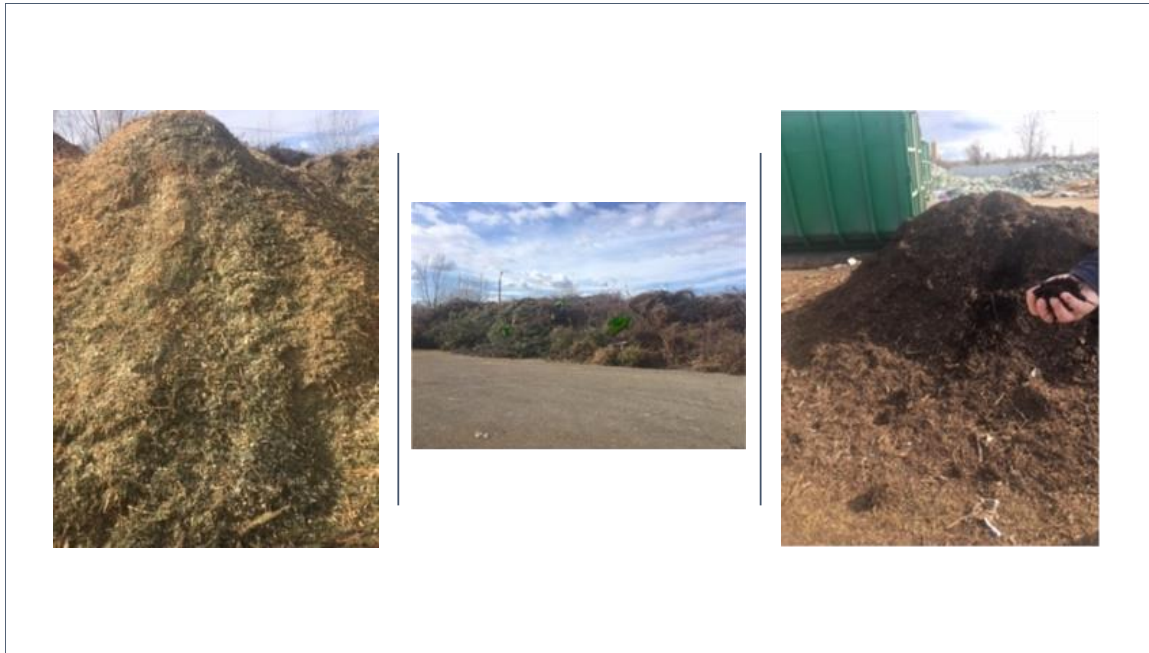
Figura 2-2 Stația de compostare Aninoasa